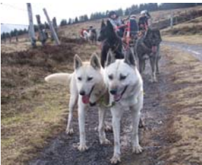
Voyage de nuit

Le centre est implanté au coeur du Parc Naturel Régional du Vercors, dans le hameau de la Tourtre à 50 km de Valence et de Grenoble. A 730 m d'altitude, le paysage composé de forêts, d'une rivière au pied de grandes falaises de calcaire va t'enchanter !