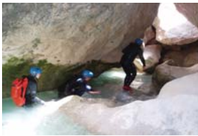
Voyage de nuit